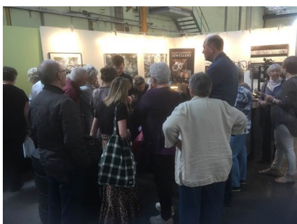
Komsammen ved Art Nordic den 21. april